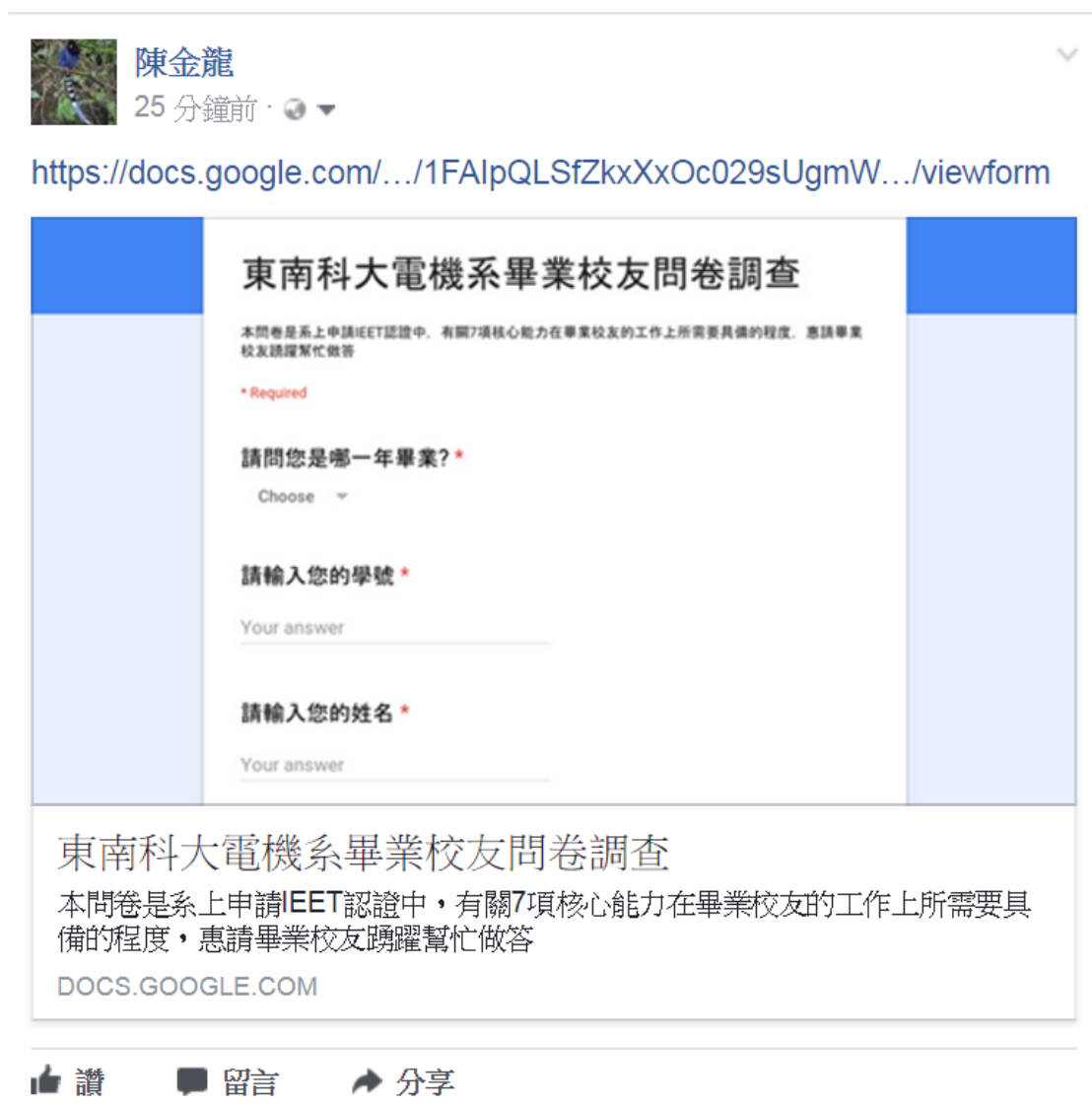
圖 3.9-2 Facebook 中公佈畢業生調查問卷