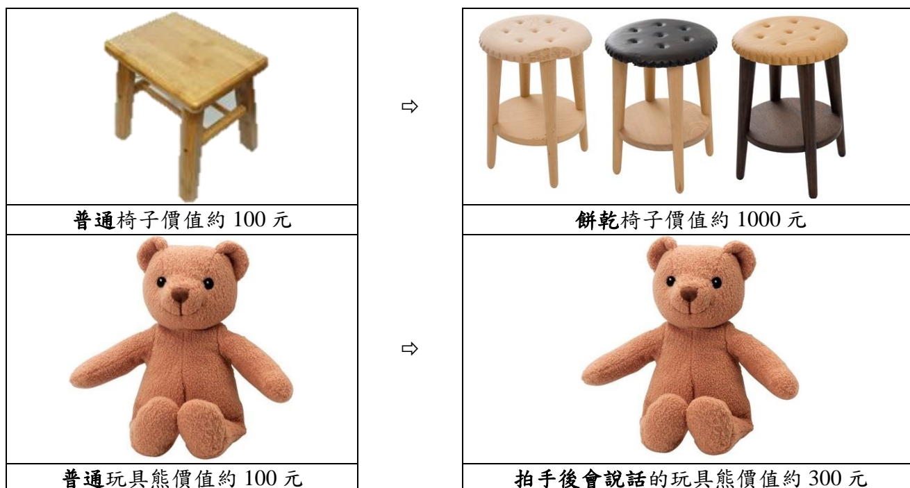
圖 3-3-1 將創意融入教學的範例

本校通識課程中所開設的創業與腦力開發、文化創意、美學經濟創意、腦力開發、視覺美學—文化意象等課程均會介紹創意、創業等相關的觀念。而本系更鼓勵老師能將創意融入課程中，以微處理機實習為例，上課教師常舉如圖 3-3-1 的範例：普通絨毛玩具熊價值約 100 元，放在眾多絨毛玩具架上不見得人家會選購它，但是將絨毛玩具熊加入『拍手後會說話』的功能，除了價值可以提高到 300 元，也會讓消費者覺得新奇而增加購買意願，而增加的電路費用不到 100 元。而普通椅子價值約 100 元，改變成餅乾的造型價值可達 1000 元而且銷路奇佳，這就是創意所帶來的附加價值。為鼓勵同學運用創意於實務技術的能力，本系非常鼓勵同學參加各式競賽，更常獲得國科會大專生專題研究計畫。